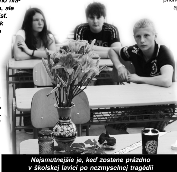
Najsmutnejšie je, keď zostane prázdno v školskej lavici po nezmyselnej tragédii