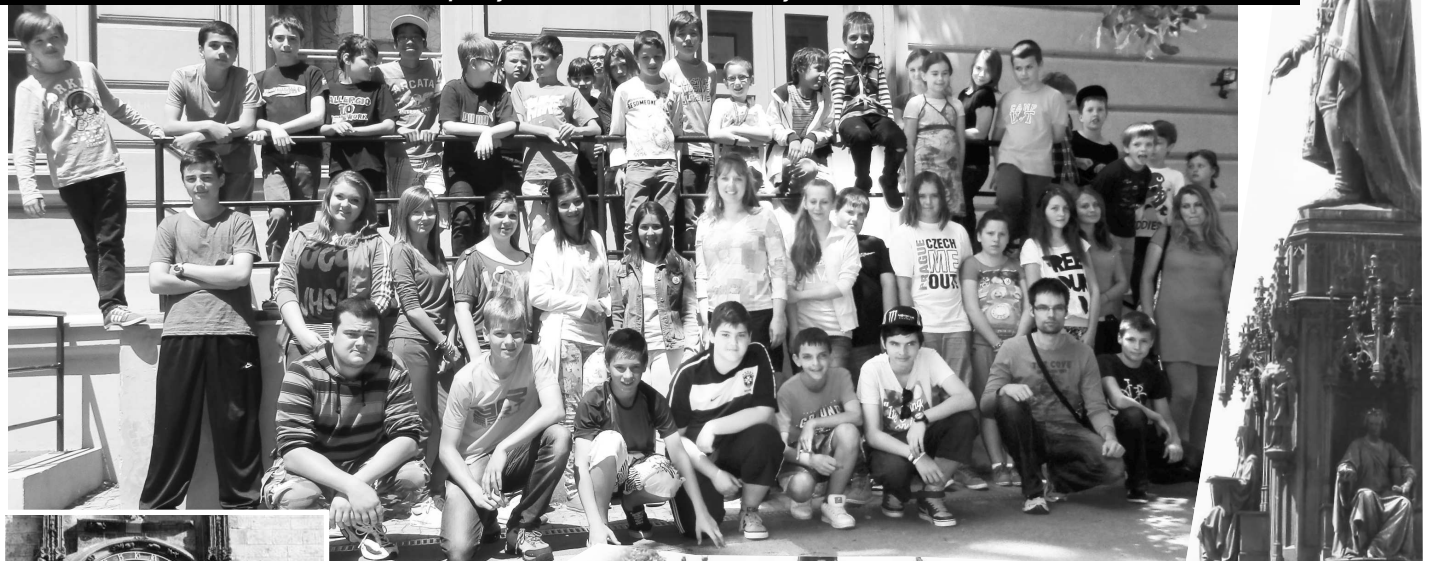
Snáď máloktorí z týchto žiakov si pamätá elánistickú pieseň Smrťka na Pražskom orloji. Z jej textu si však určite užili časť: "Turisti, vrabce, školy, orloj a apoštoly..."