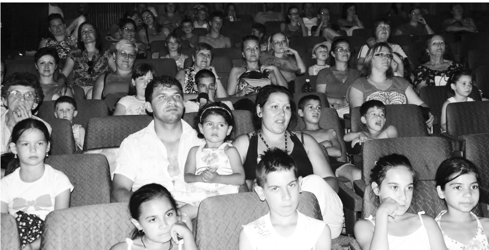
Na to, že bol skorý podvečer, sa zišlo v hľadisku dosť divákov