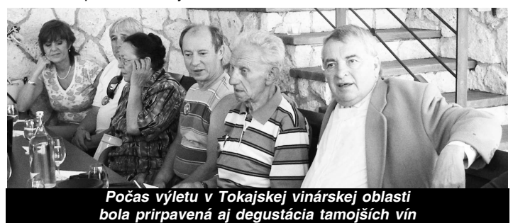
Počas výletu v Tokajskej vinárskej oblasti bola pripravená aj degustácia tamojších vín