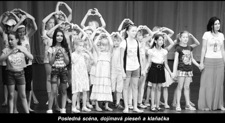
Posledná scéna, dojmavá pieseň a klaňačka