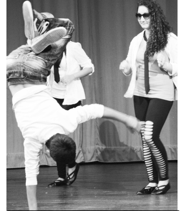
Divákov očarili aj takéto dynamické tanečné výkony