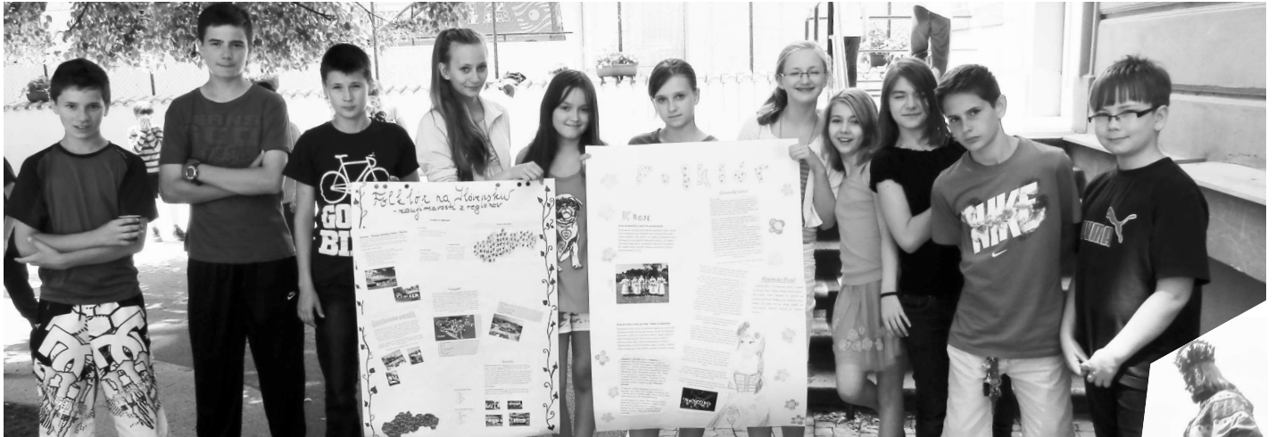
Návšteva českej metropoly, ktorá bola kedysi spoločným hlavným mestom Československa, bude pre týchto žiakov nezabudnuteľným zážitkom