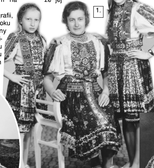
Vzácné dobové fotografie z rodinného albumu zachytávajú nielen šťastné a spokojné okamihy strávené s najbližšími, ale tiež krásne kroje, v ktorých je zachovaná vzácna ručná práca ich zhotoviteľov, ktorá má dnes už nesmiernu hodnotu.