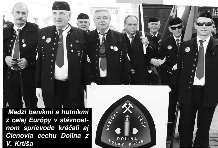
Medzi baníkmi a hutníkmi z celej Európy v slávnostnom sprievode kráčali aj členovia cechu Dolina z V. Krtíša