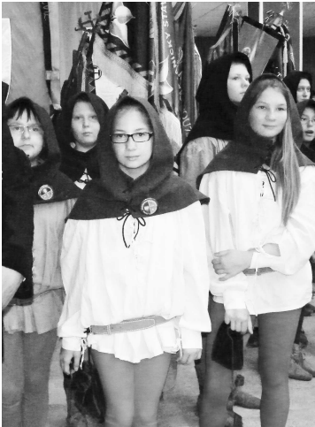
Šachtág prišli pozdraviť aj Permonici z Pezinka