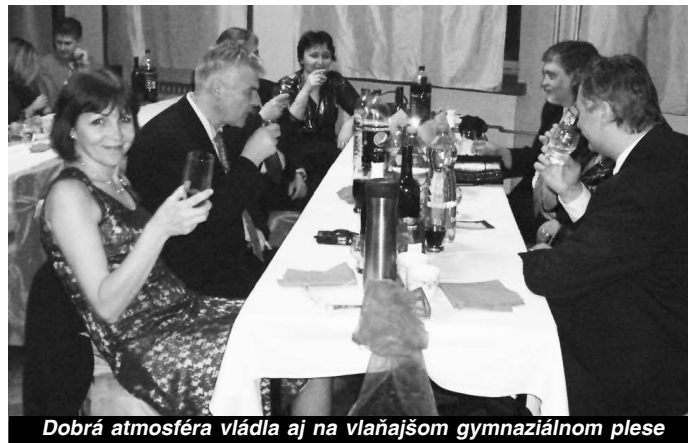
Dobrá atmosféra vládla aj na vlnajšom gymnaziálnom plesu

PRILÁSIŤ SA MÔŽETE NA T. Č. 0905 970 745