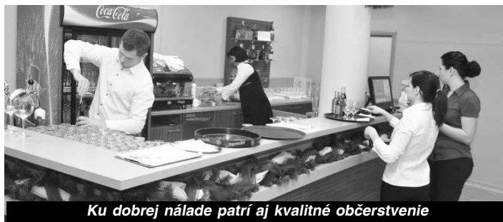
Ku dobrej nálade patrí aj kvalitné občerstvenie