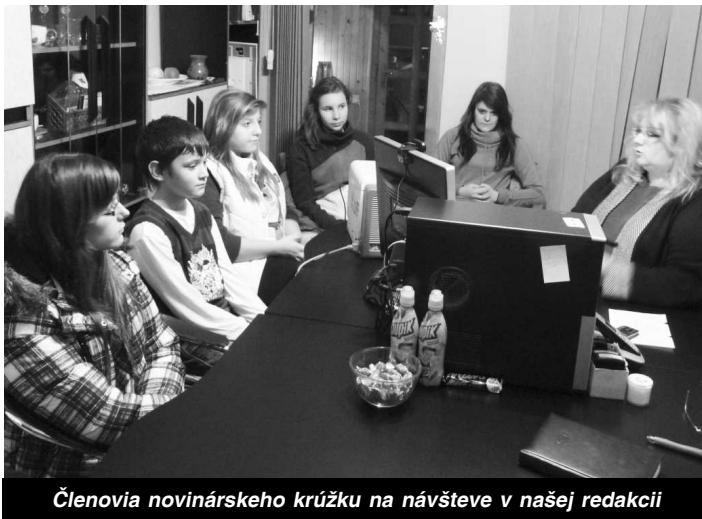
Členovia novinárskeho krúžku na návšteve v našej redakcii