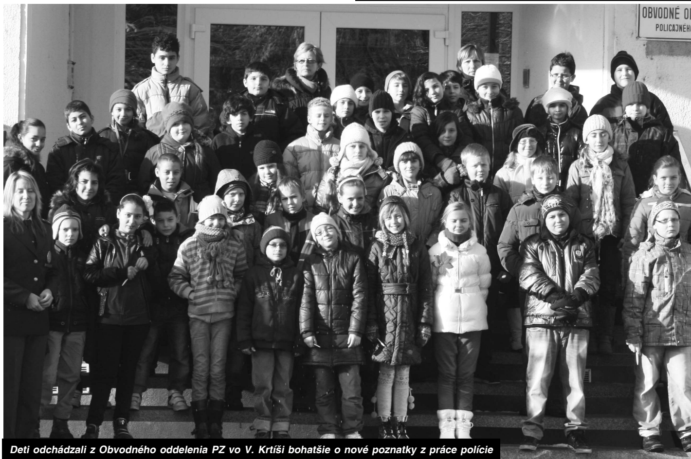
Deti odchádzali z Obvodného oddelenia PZ vo V. Krtíši bohatšie o nové poznatky z práce polície