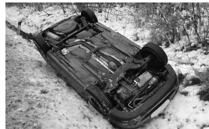
Mrznúci dážď pár dní pred Vianocami narobil na cestách poriadnu galibu