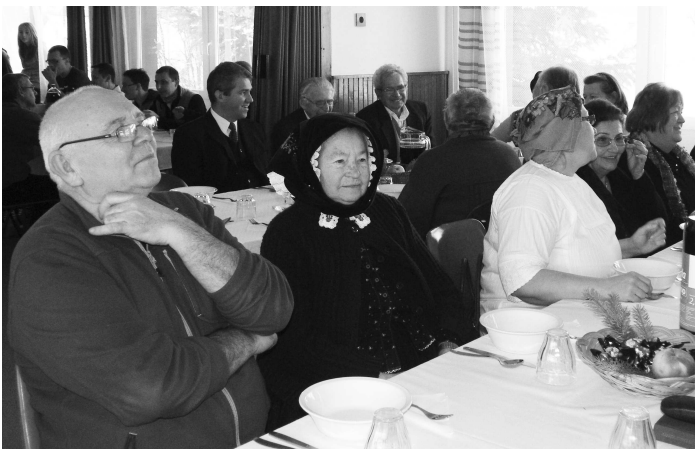
Spoločný slávnostný obed, počas ktorého si mali obyvatelia Veňarca s našimi čo povedať