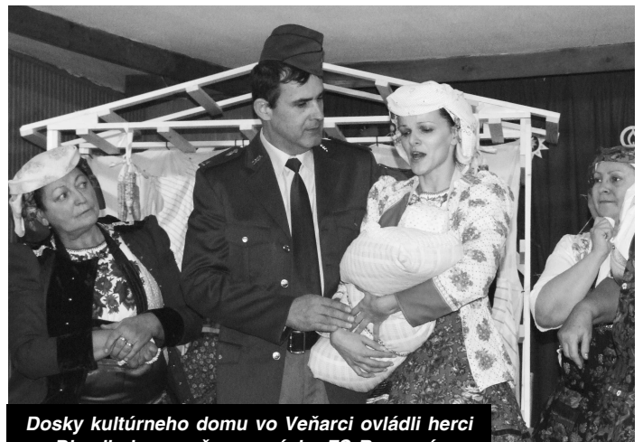
Dosky kultúrneho domu vo Veňarci ovládli herci Divadla bez groša, speváci z FS Rozmarín a dôchodcovia s vianočnými koledami