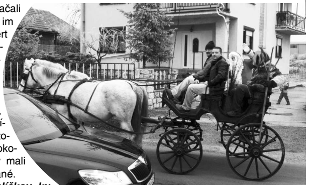
Lesenický Mikuláš prišiel do Leseníc rozdávať darčeky na takomto parádnom dvojzáprahu

"Pri rozdávaní balíčkov, ku ktorým Mikuláš s pomocníkom pripojili aj krásne priania šťastných a veselých vianočných sviatkov, sa tešili nielen deti, ale aj rodičia, ktorí veľmi podujatie ocenili. Za túto peknú vianočnú akciu chceme poďakovať všetkým prítomným poslancom ako aj pracovníkom obecného úradu. Zároveň im ako aj všetkým obyvate-