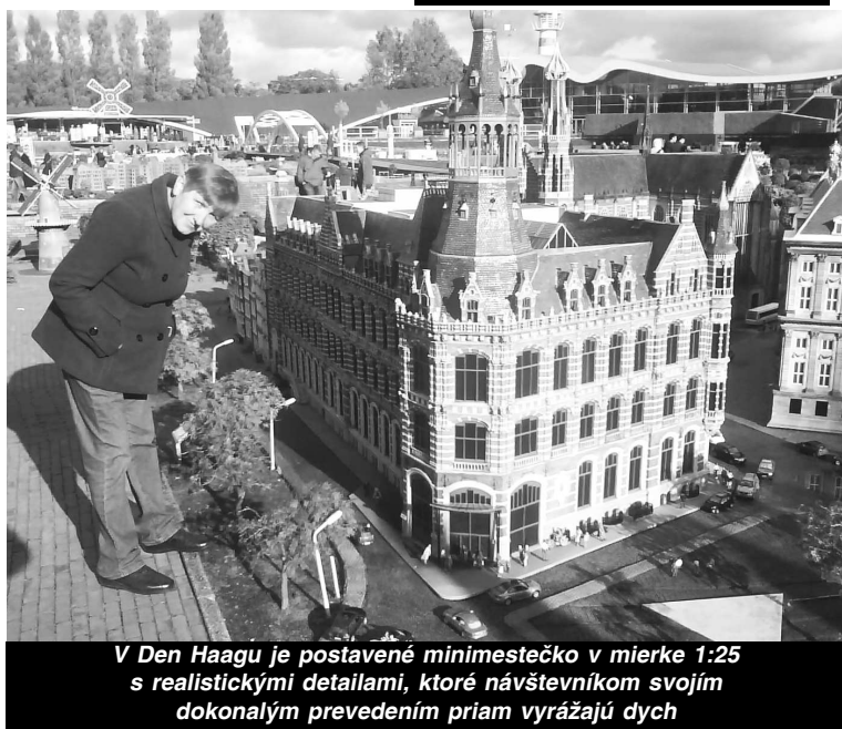
V Den Haagu je postavené minimestečko v mierke 1:25 s realistickými detailami, ktoré návštevníkom svojim dokonalým prevedením priam vyrážajú dych