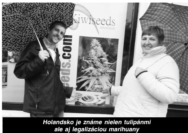
Holandsko je známe nielen tulipánmi ale aj legalizáciou marihuany