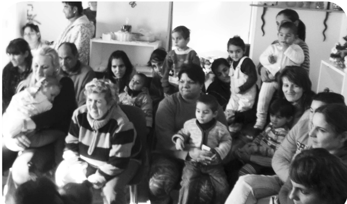
Počas návštevy Mikuláša sa rozžiarila celá škôlka - malí aj veľkí