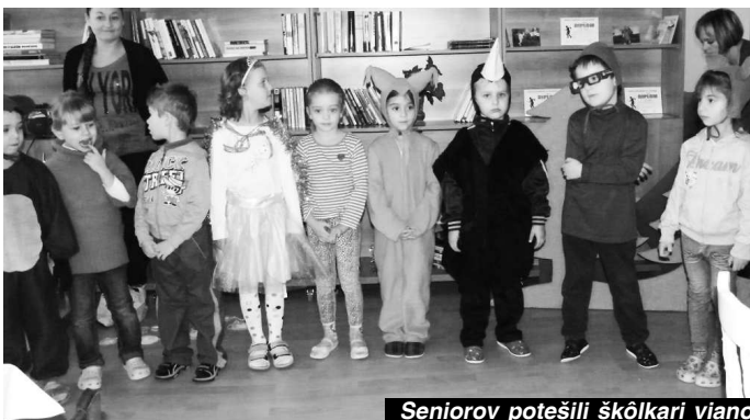
Seniorov potešili škôlkari vianočnou scénkou