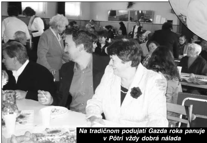
Na tradičnom podujatí Gazda roka panuje v Pôtri vždy dobrá nálada