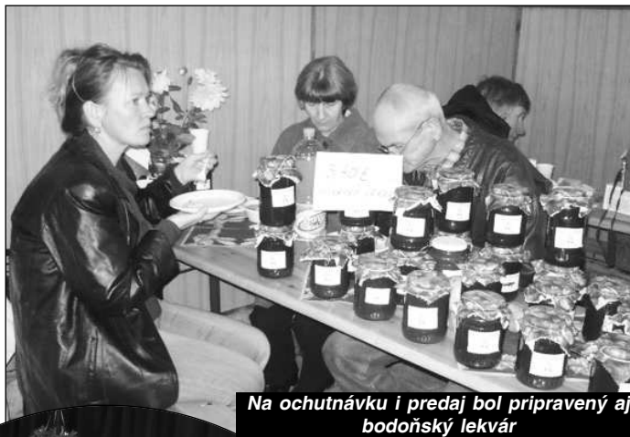
Na ochutnávku i predaj bol pripravený aj bodoňský lekvár