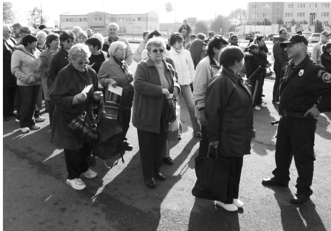
Výdaj nesprevádzal žiadny chaos, všetci si na svoju pomoc trpezlivo počkali