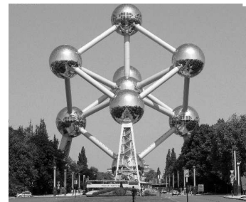
K najväčším bruselským atrakciám patrí nepochybne Atómium a Manneken Pis