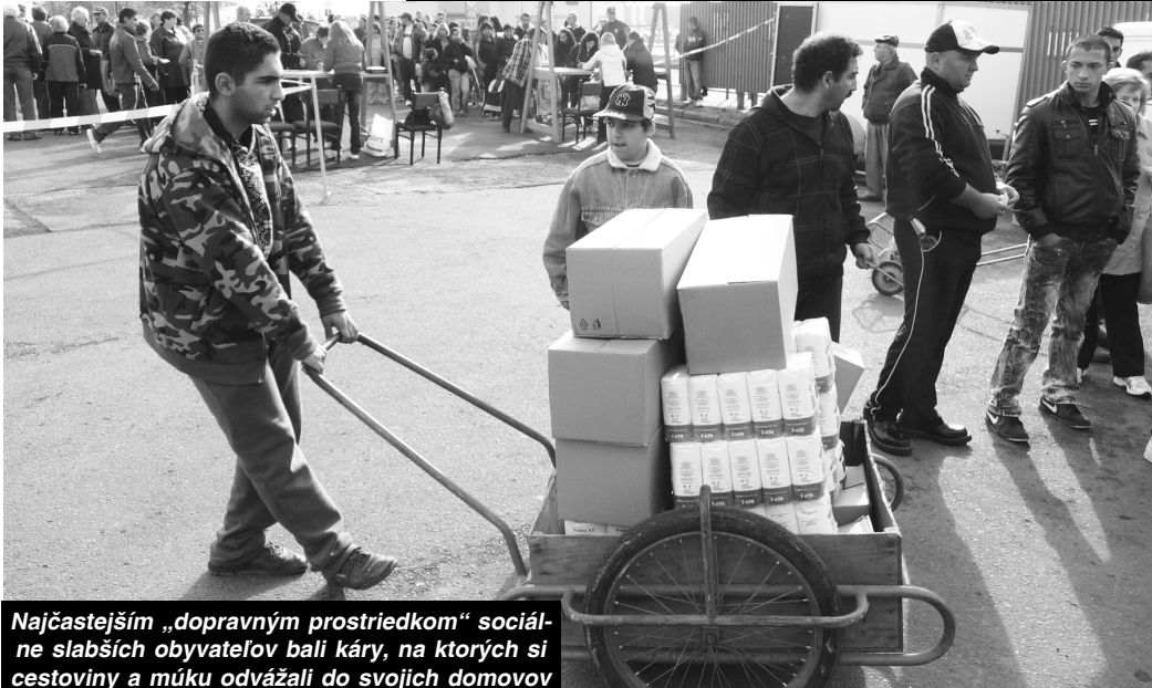
Najčastejším „dopravným prostriedkom“ sociálne slabších obyvateľov bali káry, na ktorých si cestoviny a múku odvážali do svojich domovov