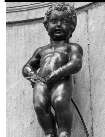
časnosť a budúcnosť sveta, Európy, a teda aj Slovenska.

Brusel vznikol pred viac ako 1000 rokmi. V súčasnosti je hlavným mestom Belgického kráľovstva a jedným z troch regiónov tvoriacich belgický federálny štát (Flámsko, Valónsko, Brusel). Brusel býva kvôli skutočnosti, že je sídlom inštitúcií EÚ a NATO, často krát označovaný za hlavné mesto Európy. Je bilingválnym hlavným mestom, oficiálnym jazykom je francúzština ako aj flámsčina. Všetky ulice a dopravné značenia sú uvedené v oboch jazykoch. Brusel je kozmopolitné mesto, kde žije spolu veľa rozličných kultúr. Vládne tu výnimočná tolerancia, príjemná atmosféra, bezpečnosť a rešpektované spolunažívanie rôznych rás, náboženstiev a kultúr.