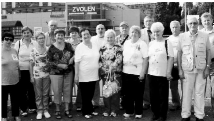
Medzi týmito fotografiami je rozdiel 1400 km a ešte viac zážitkov. Účastníci zájazdu vo Zvolene a pred európskym parlamentom v Bruseli