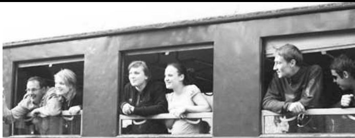
Že v našom regióne je o železnicu záujem, svedčí aj plný historický vlak, ktorý každý rok vozíva milovníkov železnice z veľkokrtíšskeho okresu na Dni železnice v Szécsényi.

vedúceho partnera zaujala Regionálna rozvojová agentúra pre rozvoj regiónu Stredného Poiplia. Agentúra spolupracovala so združením právnických osôb Regiún Neogradiensis so sídlom v Lučenci a v neposlednom rade s Občianskym združením Pre obnovu Ipelských mostov, ktoré už aj v minulosti úspešne realizovalo aktivity smerované na sprevádzkovanie železnice v Ipelskej doline. Celú štúdiu a jej závery prezentovali tvorcovia na konferencii "Spoločne - Železnicou" v Szécsényi 29.7. Ako zdôraznili, cieľom projektu je hos-