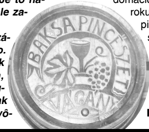
Pri oslave nedávneho jubilea POPULÁRNE Vyprevádzali ich srdceční, aj keď unavení hostitelia i prenežískame, ale pri súčasných cenách vína, ktoré vinári predajú, ak predajú, je to zanedbateľné. V prvom rade je to záľuba."