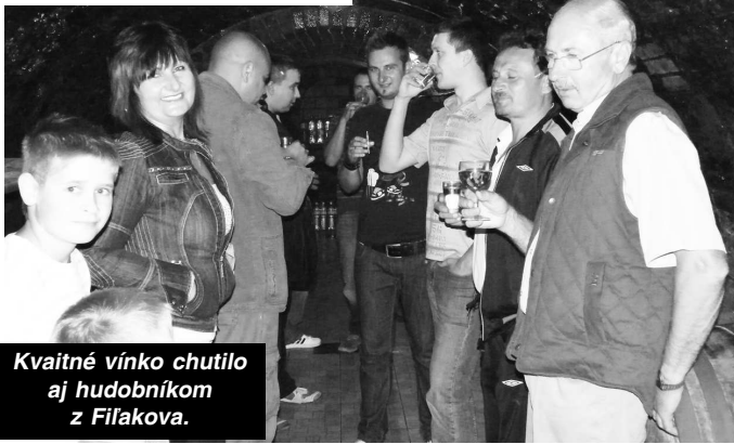
Kvaintné vínko chutilo aj hudobníkom z Filákov.

mám, ale aj ja dosť starostí. Nedávno som sa oženil a staviame si s manželkou rodinný dom. Som ale hrdý na otca, že sa mu podarilo popri svojej práci vybudovať takýto vinohrad i chatu a pivnicu v ňom. Je to namáhavá drina, ale zatial to zvláda."