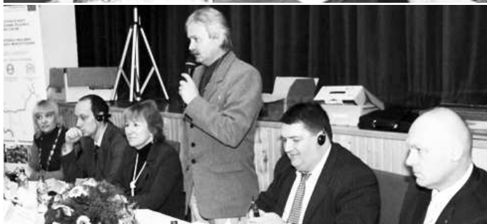
O obnovenie železničnej trate Lučenec - Sahy sa usiluje RRA pre rozvoj stredného Poiplia i OZ Za obnovu ipelských mostov už niekoľko rokov.

vedúceho partnera zaujala Regionálna rozvojová agentúra pre rozvoj regiónu Stredného Poiplia. Agentúra spolupracovala so združením právnických osôb Regiún Neogradiensis so sídlom v Lučenci a v neposlednom rade s Občianskym združením Pre obnovu Ipelských mostov, ktoré už aj v minulosti úspešne realizovalo aktivity smerované na sprevádzkovanie železnice v Ipelskej doline. Celú štúdiu a jej závery prezentovali tvorcovia na konferencii "Spoločne - Železnicou" v Szécsényi 29.7. Ako zdôraznili, cieľom projektu je hos-